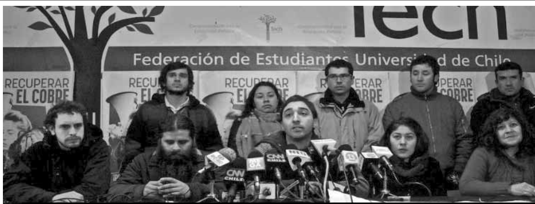
La "unidad por arriba" de la dirección de SITECO, portuarios, ACES y CONFECH