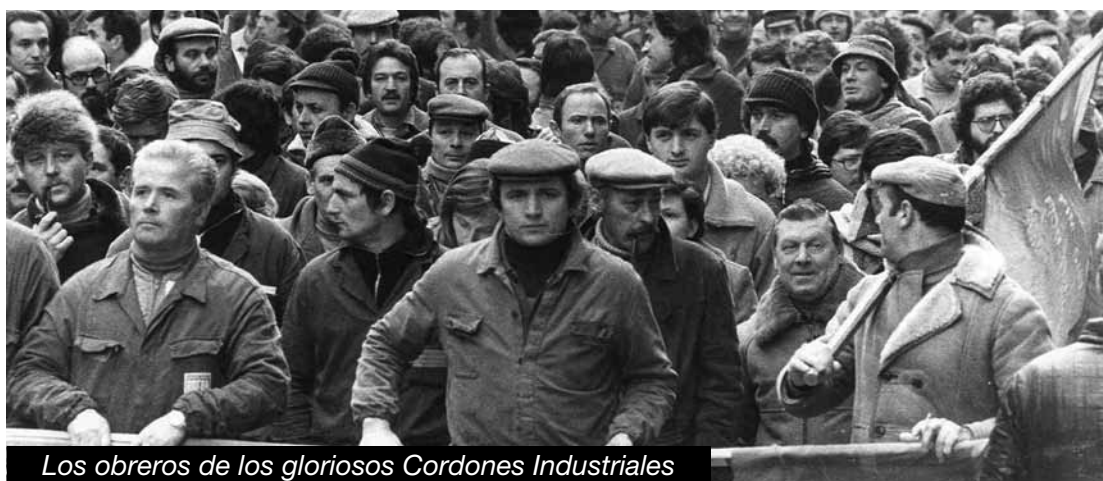
Los obreros de los gloriosos Cordones Industriales

¡Basta de despidos! ¡Reincorporación inmediata de todos los trabajadores despedidos del puerto de Mejillones, del Transantiago, de la mina Sierra Gorda y de toda la minería!