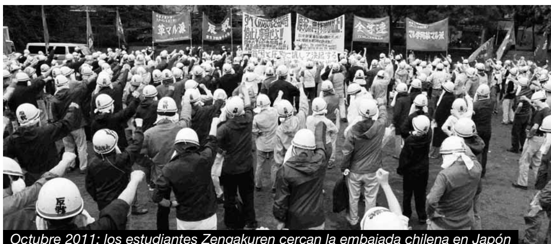
Octubre 2011: los estudiantes Zengakuren cercan la embajada chilena en Japón

Pero aún hacía falta garantizar que la Bachelet tenga "paz social" para asumir el gobierno. Desde la Cumbre de la CELAC, ese "ministerio de colonias" de Obama, todos los gobiernos latinoamericanos centralizaban su ataque contra la clase obrera. En Chile era vital para el imperialismo propinarle una derrota decisiva a la vanguardia obrera, es decir, a los portuarios de Mejillones que salieron a la huelga a fin de año al grito de "unidad de eventuales y contratados". Esta demanda no podía extenderse al resto de los puertos, ni las minas ni a ningún sector porque concen-