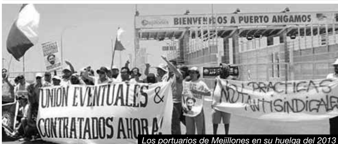
Los portuarios de Mejillones en su huelga del 2013

mineros en las mesas de negociación, buscando hacer lo mismo con los estudiantes, para desgastar su lucha. Todas las direcciones traidoras jugaron su rol para impedir a cada paso que una acción independiente de masas descalabrara y dejara herido de muerte al régimen cívico-militar.