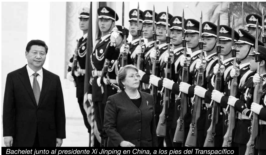
Bachelet junto al presidente Xi Jinping en China, a los pies del Transpacífico

Es el régimen de la Constitución del '80 que se dedica a reprimir toda lucha en curso a lo largo del país, encarcelando y persiguiendo a los luchadores obreros y populares, mientras garantiza de la mano de la justicia pinochetista la más absoluta impunidad para los milicos genocidas, asesinos de los obreros de los Cordones Industriales y de miles de obreros y explotados, así como de todos los políticos pa-