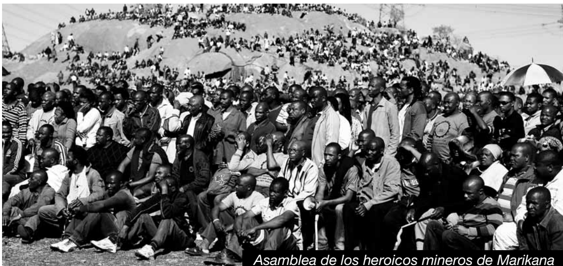
Asamblea de los heroicos mineros de Marikana

Garantizando la más absoluta independencia de clase de nuestras organizaciones, impuesta desde la base obrera con sus asambleas, ese Congreso podría ser una