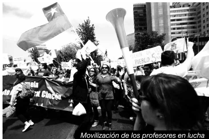
Movilización de los profesores en lucha

Estos entregadores de nuestra lucha pretenden que nunca más se escuche nuestro grito de "educación primero al hijo del obrero, educación después al hijo del burgués" . La huelga de profesores desenmascara el engaño que quieren imponerle a los trabajadores y los explotados. Fue la base docente la que impuso que hoy el burócrata Gajardo rompa la mesa de diálogo con el gobierno. Pero hoy la política de la burocracia del PC es montarse sobre el paro para que éste se limite a ser una medida de presión sobre el gobierno, cuando ya está demostrado que la "reforma educativa" es una farsa y