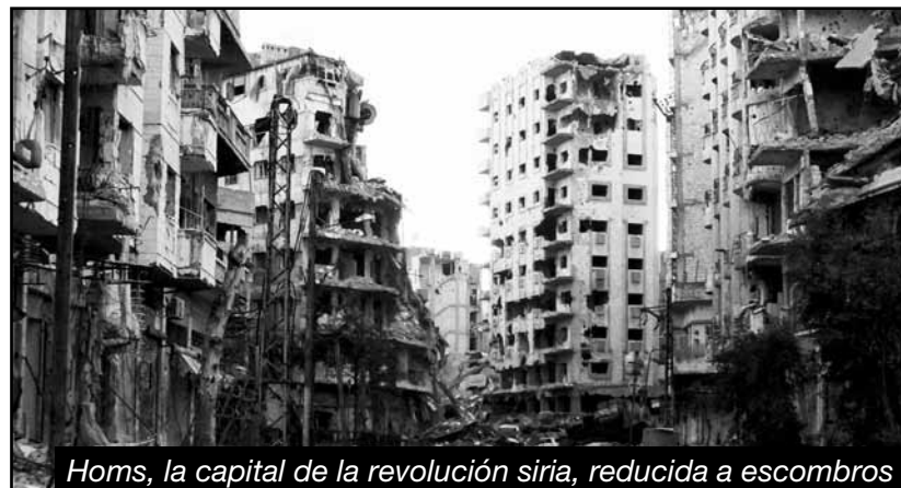
Homs, la capital de la revolución siria, reducida a escombros

Ni un tiro disparó Obama para parar la masacre, en todos estos años de genocidio. Ahora, en la Siria partida y libanizada, tira bombas de advertencia contra su agente el ISIS para limitar su accionar y para avisar quién es el verdadero dueño de Siria... el que se quedará con todos los negocios después de la masacre.